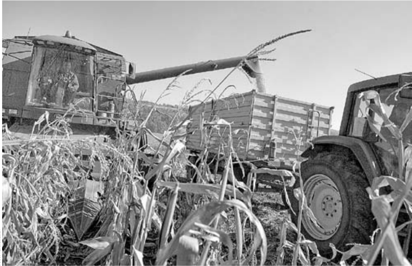
A mezőgazdaság a tavalyi jó időjárásnak is köszönhetően nagyban hozzájárult ahhoz, hogy megmoccant a gazdaság

A magyar gazdaság 2013-ban stagnáló (+0,1 százalékos) EU-hoz és a még visszaeső (-0,4 százalékos) euróövezetbe képest kedvezően, 1,1 százalékkal növekedett. Ebből azonban 0,9 százalékpont volt az agrárium hozzájárulása, s ennek következtében a magnövekedés – az agrárium és költségvetési szektor nélküli növekedés – mindössze 0,1 százalékos volt. Az ipari termelés 2013-ban 1,4 százalékkal emelkedett, de nem érte el a 2011. évi szintet. Az ipar által termelt jövedelem (GDP) egyáltalán nem nőtt. Az építőiparban hét évi visszaesés után 2013-ban erőteljes fellendülés kezdődött, elsősorban az uniós támogatások „kapuzási pánikot” idéző gyors felhasználása következtében. A kiskereskedelem – hatévnyi visszaesés után – a 2,5 százalékos növekvő reáljövedelmek ellenére csak 0,9 százalékkal bővült. Az utolsó negyedévben azonban már 3 százalékos volt a forgalombővülés, amit januárban csaknem 4 százalékos követett. A pénzügyi GDP 2013-ban negyedik éve csökkent, de ennek üteme 2013-ban már „csak” 1,5 százalékos volt. Folytatódott a vállalati és lakossági hitelállományok leépülése. 2014-ben az iparban némi, exportvezérelt gyorsulás, az építőiparban viszont lassulás valószínű. A szolgáltató ágazatok tevékenysége bővül, a