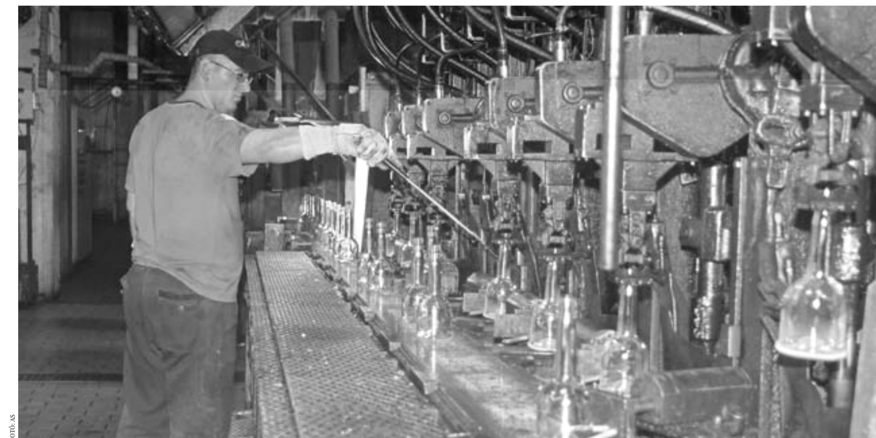
Az alacsonyabb keresetűek esetében bérkompenzációval igyekezett a kormány ellensúlyozni a kedvezőtlen adóváltozásokat, ám ez sok vállalkozás számára komoly terhet jelent

Az előírásokat teljesítő cégeknek azonban a bérköltség növekedése kényszerű létszámcsökkentést, illetve a részmunkaidős foglalkoztatás arányának emelkedését okozhatja. Ezt támasztja alá, hogy 2012 első két hónapjában a versenyszférában decemberhez képest 1,8 százalékkal, az előző év azonos időszakához képest pedig 1,6 százalékkal csökkent az alkalmazásban állók létszáma. (A 2011. évi átlaghoz képest 2,9 százalékkal.) Emellett számos ágazatban január-február folyamán jelentősen csökkent a teljes munkaidőben foglalkoztatottak aránya